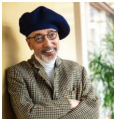
テリー伊藤氏 演出家