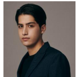
kemio氏 インフルエンサー