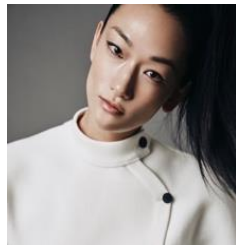
富永 愛氏 ファッションモデル