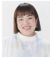
ゆりやんレトリィバァ氏 ファッションista